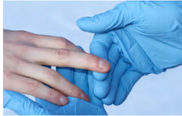
Fingernagelprobe/Messen der Rekapillarierungszeit