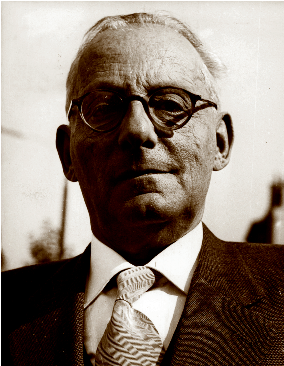
Max Brod, Kafkas langjähriger Freund und erster Biograf