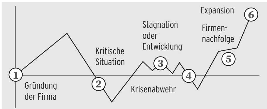
Der typische Erfolgsweg bei einem Unternehmen (nach: Fiege Consult Unternehmensberatung Ltd.)

Jeder Mensch hat sehr individuelle Persönlichkeitsmerkmale. Und ebenso einzigartig wie die eigene Persönlichkeit ist auch der (Lebens)Weg, der zum persönlichen Erfolg führt. Von daher gibt es keine „maßgeschneiderten“ und auf alle Menschen gleichermaßen anwendbaren Erfolgsstrategien, aber es gibt bestimmte „Werkzeuge“, die dazu beitragen können, ein erfolgreiches Leben zu führen. In meinem Fall ist es ein Zusammenspiel aus Mentaltraining, Bewusstseinsstraining sowie der Bewusstmachung der Spiegelgesetze. Diese Triade, gepaart mit meiner Lebenserfahrung und seelischen Erkenntnissen, hat mich auf meine persönliche Erfolgsspur gebracht. Ich bin davon überzeugt, dass es sich für jeden Menschen lohnt, sich diese „Werkzeuge“ zu eigen zu machen, um seine innewohnenden und größtenteils nur teilweise genutzten Fähigkeiten und Erkenntnisse zu wecken und zu voller Entfaltung zu bringen.